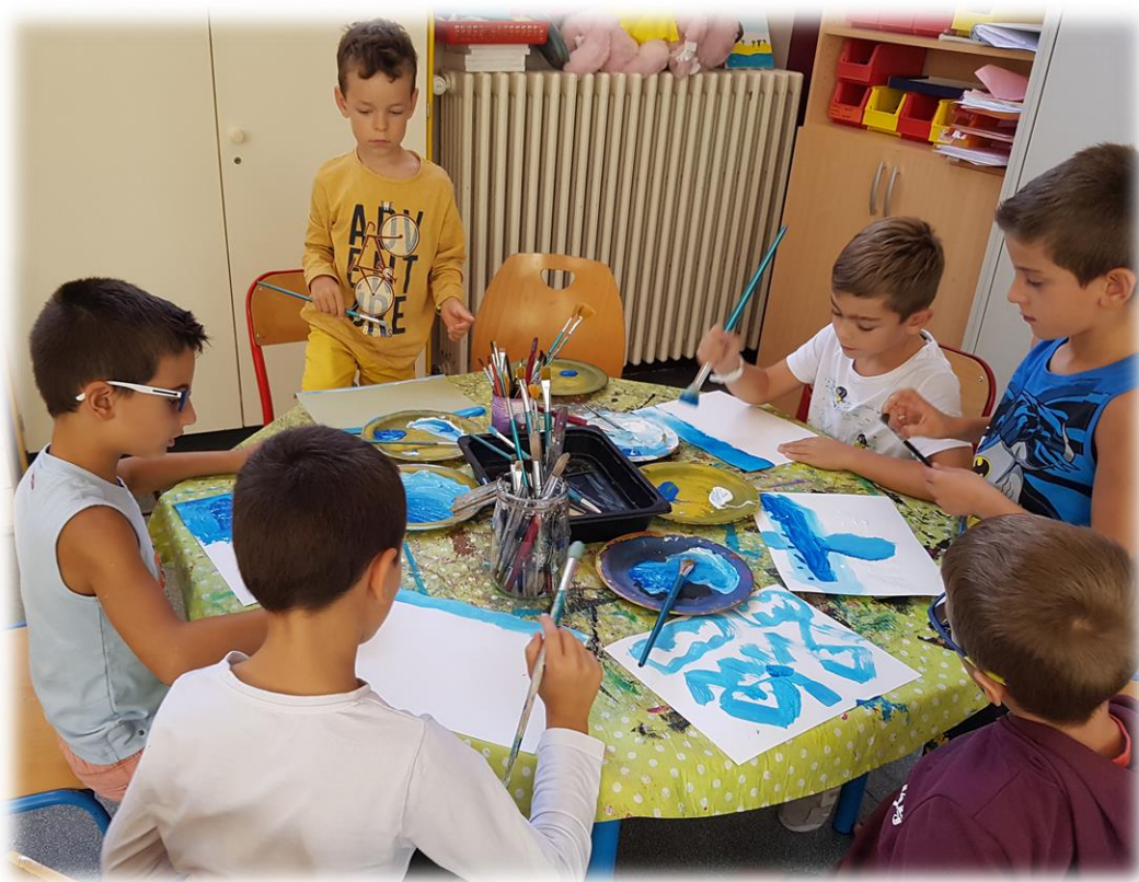
De Mafisse à Klein ...vive le bleu !