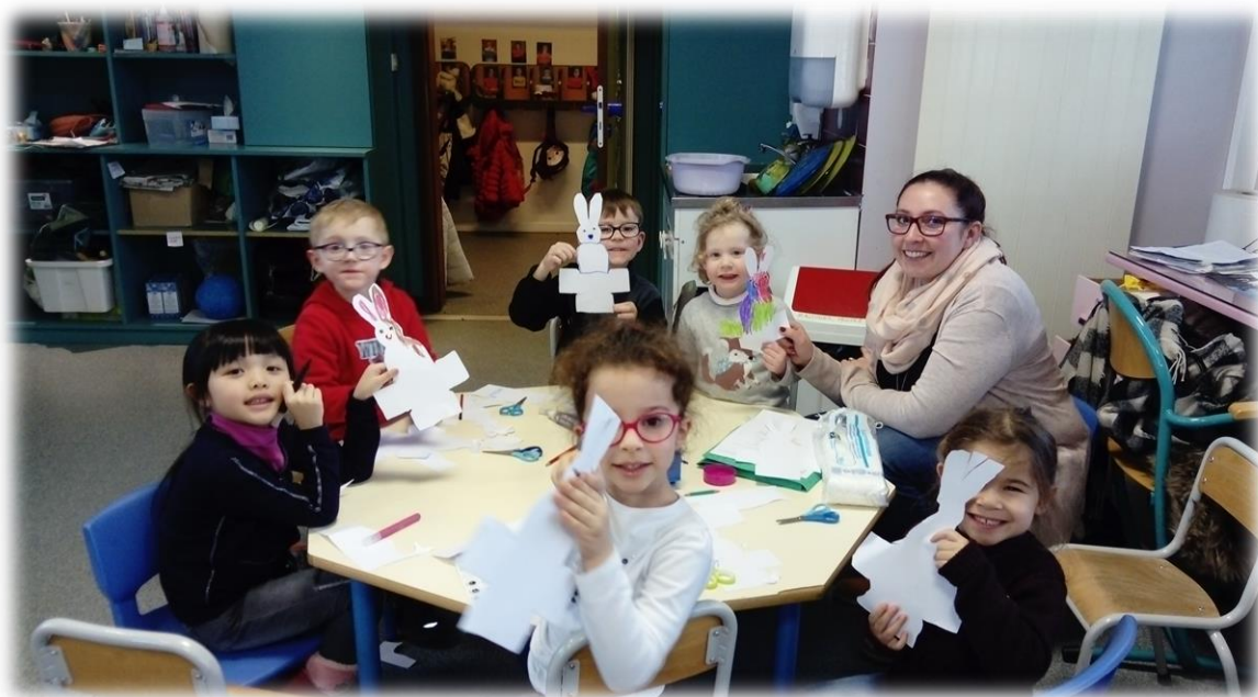
En pleine préparation de Pâques !

Les enfants ont participé à de nombreux évènements calendaire tout au long de l'année.