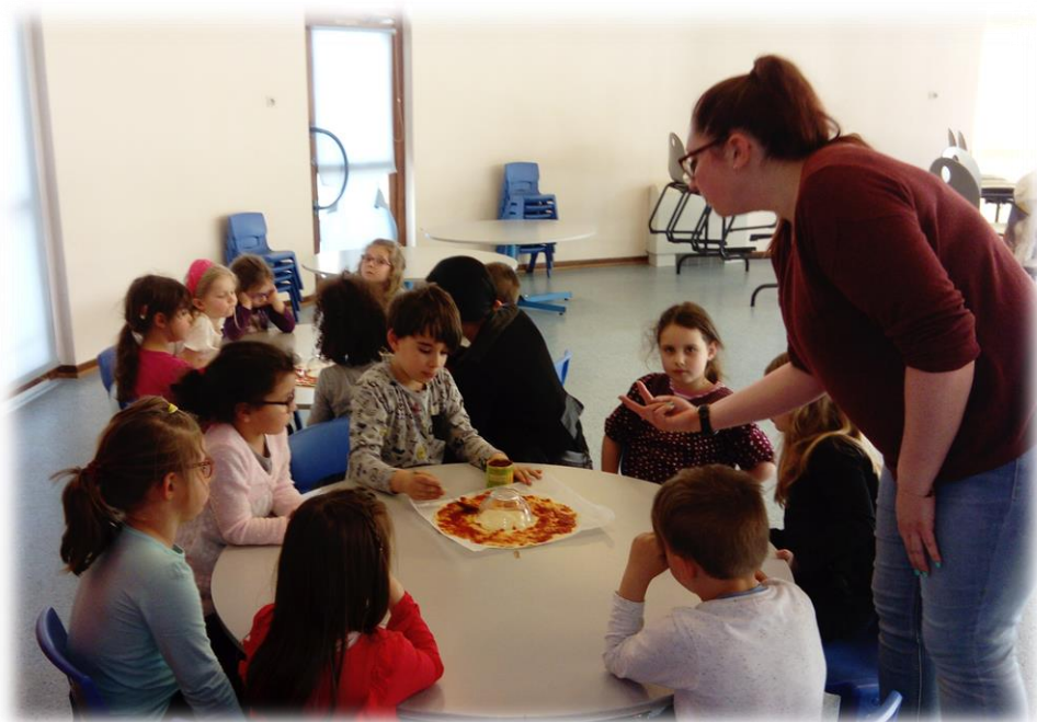
Atelier cuisine du mercredi

Et des activités hebdomadaires, juste pour le plaisir !