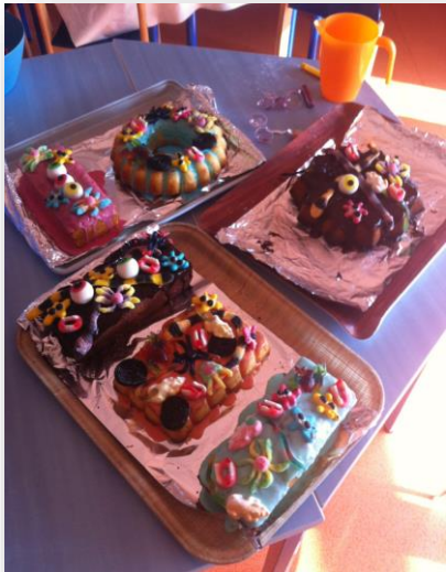
Les gâteaux de l'horreur !

Tout au long de l'année, les parents sont invités à des goûters festifs. Des événements sont également élaborés pour les fêtes (Halloween par exemple) ainsi qu'une grande fête de fin d'année « La Récré' Action ».