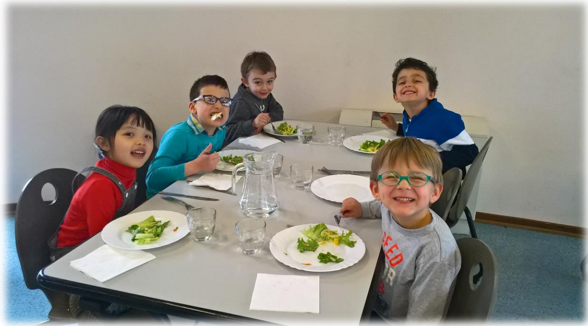
Miaaaaam la salade !

Depuis septembre 2018, les enfants sont herbivores, et ils adorent !