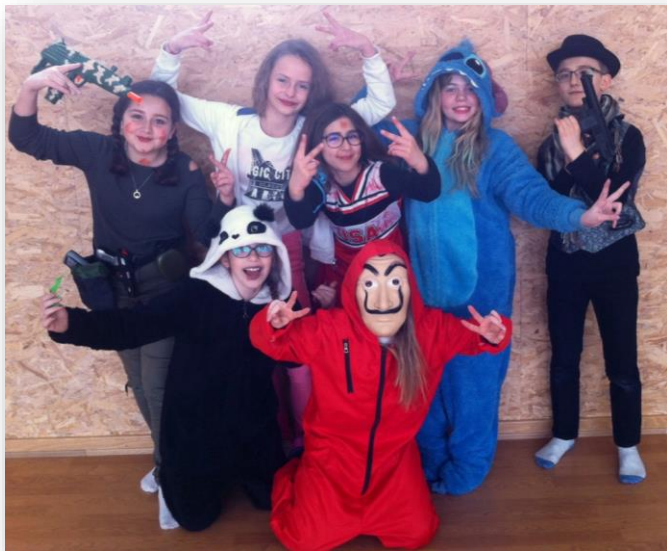
Et c'est parti pour la fête !