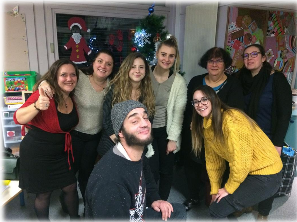
La fine équipe après les festivités