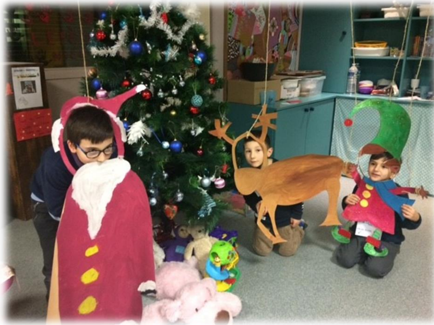
Place à la détente...