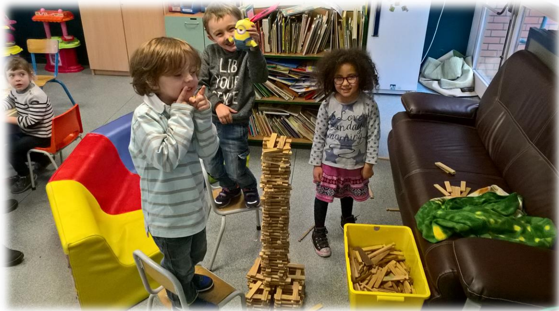
Un soir au péri : défi Kapla