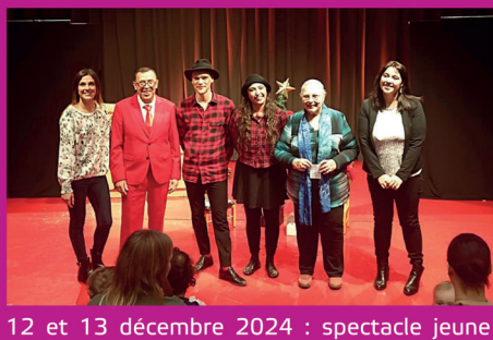
12 et 13 décembre 2024 : spectacle jeune public « Ohlala Léon, c'est Noël » offert par le CCAS aux écoles maternelles des écoles, à des enfants suivis par le CCAS et à des enfants de l'association Résonance. Il a été également ouvert au grand public dans le cadre de la saison culturelle.