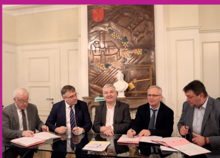
19 janvier 2024 : signature du contrat de mixité sociale