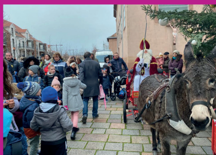
5 décembre 2023 : venue de Saint-Nicolas