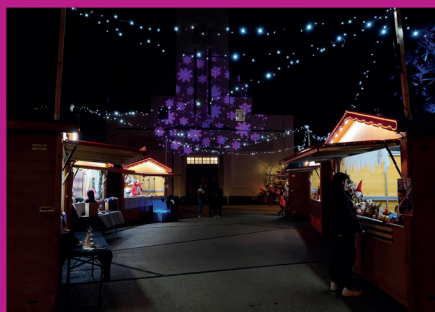
Du 8 au 10 décembre 2023 : marché de Noël de Logelbach