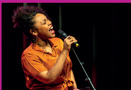
10 janvier 2024 : concert de Selia