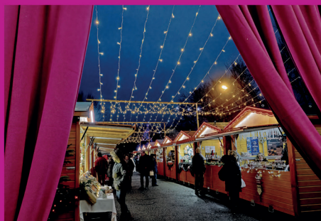
Du 1 er au 3 décembre : Marché de Noël de Wintzenheim