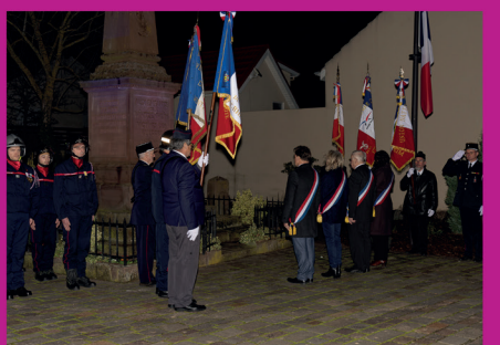
2 février 2024 : 79 ème anniversaire de la libération de Wintzenheim