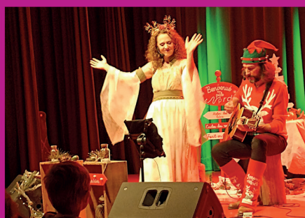
20 décembre 2023 : spectacle jeune public « C'est quoi Noël ? » de Marikala