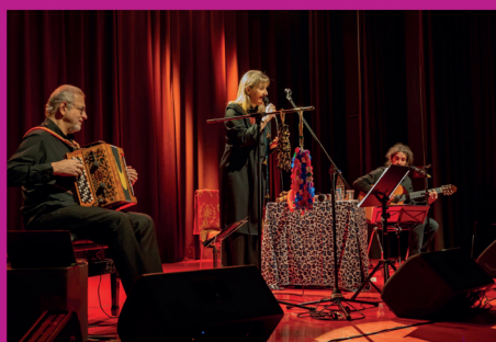
6 décembre 2023 : concert de Do Montebello